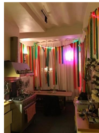
Het "Hoes vaan Henk" waar een mooie carnavalsactie plaatsvond