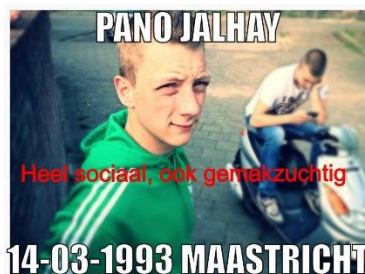
3,5 jaar geleden